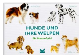
Hunde und ihre Welpen Memo-Spiel, Preis ca. 14,90 €