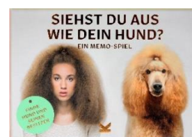
Siehst du aus wie dein Hund? Memo-Spiel, Preis ca. 15,90 €

** Hund-Bingo ** Dieses wunderschön illustrierte Bingo-Spiel stellt 64 Hunderassen aus der ganzen Welt vor. Entdecken Sie die verschiedenen Arten von Hunden – vom winzigen Chihuahua bis zur edlen Dogge, markieren Sie sie auf Ihrer Karte – und Bingo! Das Spiel beinhaltet ein Falblatt mit wissenswerten und verrückten Informationen zu allen vorgestellten Hunderassen.