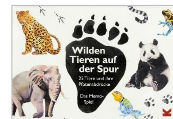
Autor: Marcel George, Preis ca. 14,90 €

Die Vertriebsgesellschaft Hutter Trade erblickte 2004 das Licht der (Unternehmens-)Welt. Zeitgleich wurde die Verlagsmarke HUCH! gegründet, die wiederum durch Hutter Trade vertrieben wird. Seitdem gehen die Entwicklung als auch der Vertrieb von ausgezeichneten und abwechslungsreichen Spielen Hand in Hand. Mit innovativen Kinder- und Familienspielen mit Lifestyle-Charakter, Strategiespielen und facettenreichen Vertriebsprodukten haben sich HUCH! und Hutter Trade ein ganz eigenes Profil geschaffen.