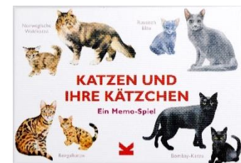
Preis ca. 14,90 €