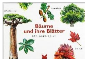
Autor: Tony Kirkham, Preis ca. 14,90 €

** Wilden Tieren auf der Spur** Ein tolles Spiel für die Fährtenleser in der Familie! 25 Spuren von wilden Tieren: Wer kann sie richtig zuordnen? Hat gerade ein Elefant Ihren Weg gekreuzt, oder war es ein Ameisenigel? Schlagen Sie Ihren – großen oder kleinen – Gegner, indem Sie so viele Treffer landen wie ein erfahrener Fährtenleser!